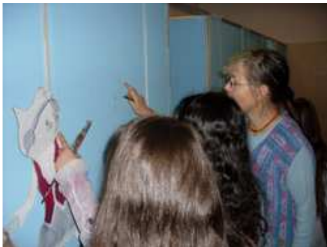
Übertragen der Schablonengrundrisse auf die Wände

Doch zuerst mussten die Wände und Türen aufwendig vorbereitet werden. Mit Hilfe des Hausmeisterteams wurden die Flächen von den Erwachsenen des Projektteams im Herbst 2009 angeschliffen, mit einem Haftanstrich gestrichen und schließlich meerwasserblau grundiert. Gleichzeitig fanden sich 6 Eltern und eine Lehrerin, die die Aufgabe übernahmen, nach Abschluss der Motivgestaltung die Flächen mit Lack zu versiegeln. Zu diesem Zeitpunkt zeichnete sich ab, dass die Umsetzung mit den Mitteln des Aktionsfonds erfolgreich sein würde. Daher wurde in Absprache mit dem Quartiersmanagement beschlossen, das Toilettenprojekt aus den Mitteln des Projekts ‚Schule sind wir! – Partizipation fördern an der James-Krüss-Schule‘ fortzuführen, um so alle Toiletten umgestalten zu können.