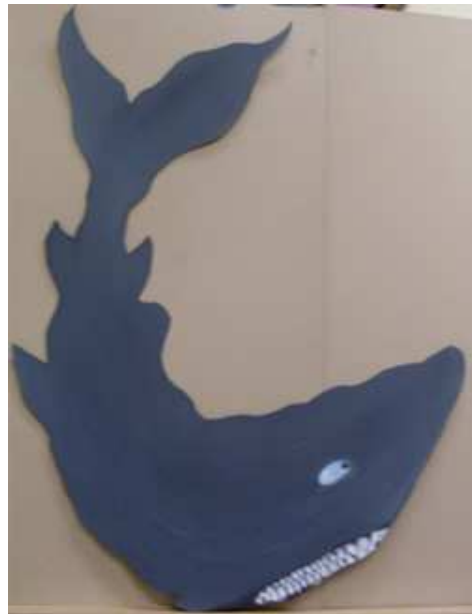
Beispiele für die Schablonen

Doch zuerst mussten die Wände und Türen aufwendig vorbereitet werden. Mit Hilfe des Hausmeisterteams wurden die Flächen von den Erwachsenen des Projektteams im Herbst 2009 angeschliffen, mit einem Haftanstrich gestrichen und schließlich meerwasserblau grundiert. Gleichzeitig fanden sich 6 Eltern und eine Lehrerin, die die Aufgabe übernahmen, nach Abschluss der Motivgestaltung die Flächen mit Lack zu versiegeln. Zu diesem Zeitpunkt zeichnete sich ab, dass die Umsetzung mit den Mitteln des Aktionsfonds erfolgreich sein würde. Daher wurde in Absprache mit dem Quartiersmanagement beschlossen, das Toilettenprojekt aus den Mitteln des Projekts ‚Schule sind wir! – Partizipation fördern an der James-Krüss-Schule‘ fortzuführen, um so alle Toiletten umgestalten zu können.