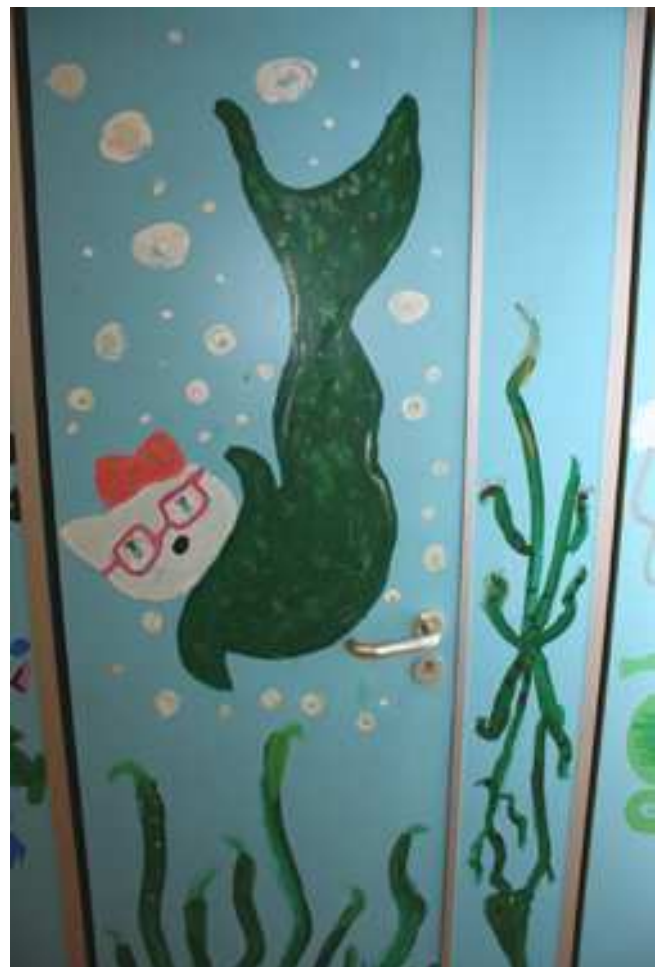
Beispiele für die Gestaltung der Mädchentoiletten