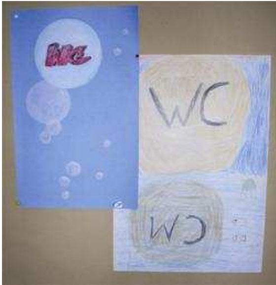
Beispiele für die künstlerische Bearbeitung der Gestaltungsideen der Kinder

Für die gestalterische Umsetzung konnten die Mitarbeiterinnen der Vip-Lounge, einem Kreativprojekt aus Moabit-West als Kooperationspartnerinnen gewonnen werden. Sie schlugen dem Schülerparlament vor, die Bildentwürfe der Kinder künstlerisch zu reduzieren und daraus Schablonen zu entwickeln, mit denen die Kinder die Flächen gestalten. Dies fand große Zustimmung bei den Kindern. Gleichzeitig einigten sie sich auf ein einheitliches Thema: ‚Meer, Piraten und Meerestiere‘