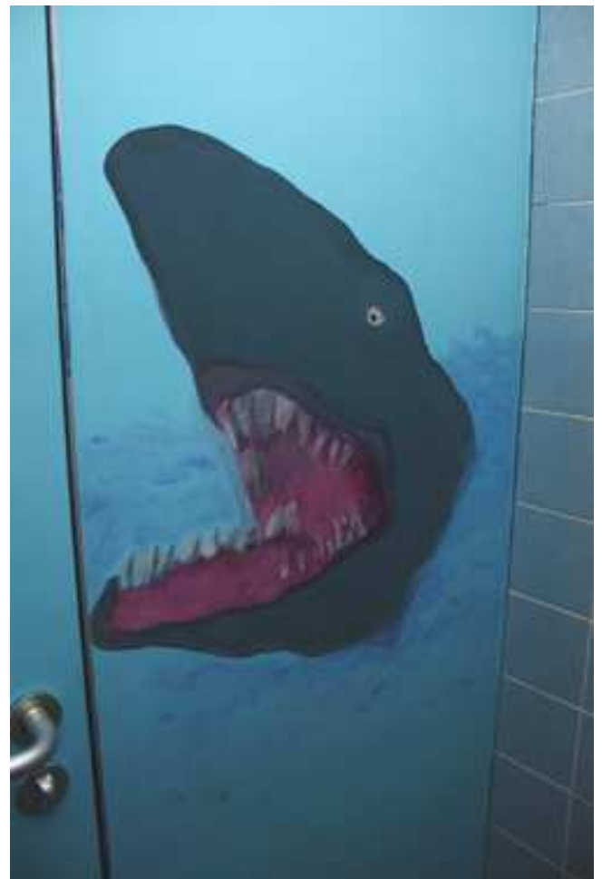
Beispiele für die Gestaltung der Jungentoiletten