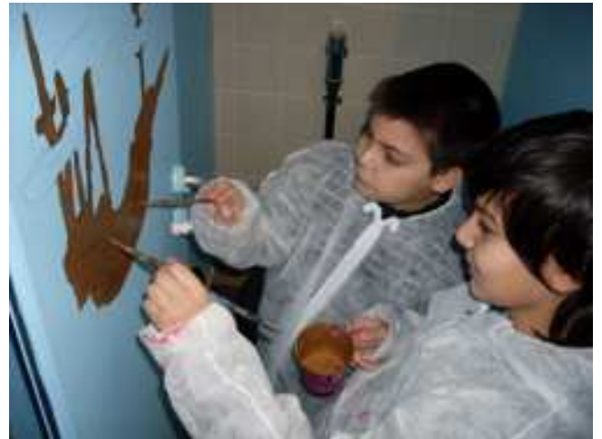
Junge Künstler und Künstlerinnen bei der Arbeit

Auf den Jungentoiletten springt einem ein Hai entgegen und Seeräuberschiffe und Piraten verfolgen aufmerksam, ob sich alle auf der Toilette benehmen. Bei den Mädchen funkeln glitzernde Seepferdchen, Piratinnen im Hello-Kitti-Look, Meerjungfrauen und allerlei anderes Meeresgetier. Alles wurde abschließend mit helfenden Eltern an einem Samstag mit einer Lackschicht überzogen, damit die Kunstwerke gut geschützt sind.