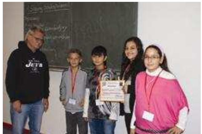
Die Scheckübergabe im Schülerparlament